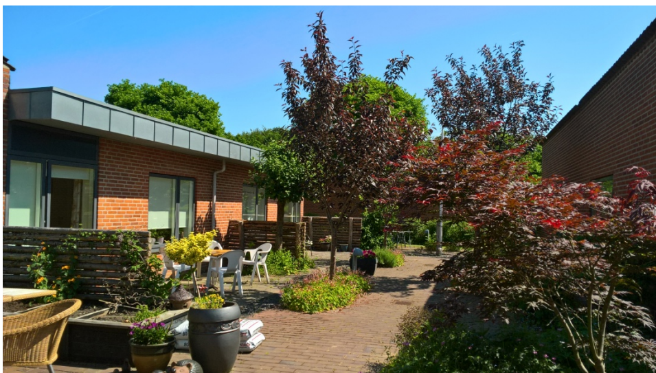
Terrassen hus 102

På Hovergården er man i gang med en proces, hvor vi arbejder på ældrebaseret fællesskab, hvor alle kan vokse og gro, og hvor livet er værd at leve. Vores vision er at eliminere; ensomhed, kedsomhed og hjælpeløshed, med redskaber som bl.a. samværet med børn, dyr og planter.