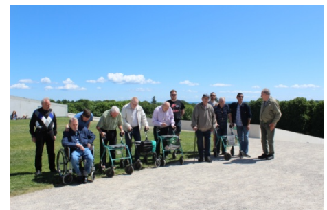
Herrelogen på tur