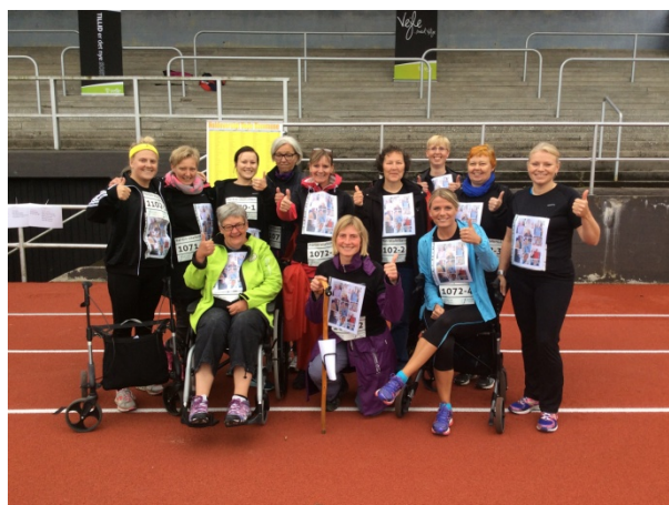
Fertin stafet 2014

Gavekasse koster 20kr om måneden til fødselsdag og andre festlige lejligheder, spørg evt. dem der står for gavekassen.