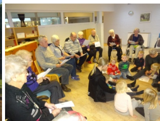
Besøg af børnehave