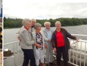
Tur til Silkeborg